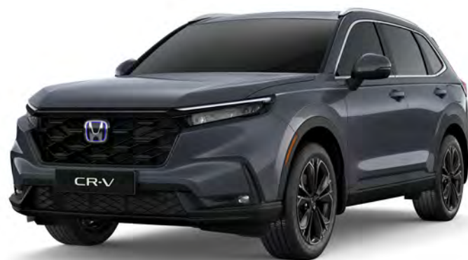
Cinza Basalto Metálico

Interior cinza claro disponível nas cores externas Branco Topázio Perolizado, Azul Astral Metálico e Cinza Basalto Metálico