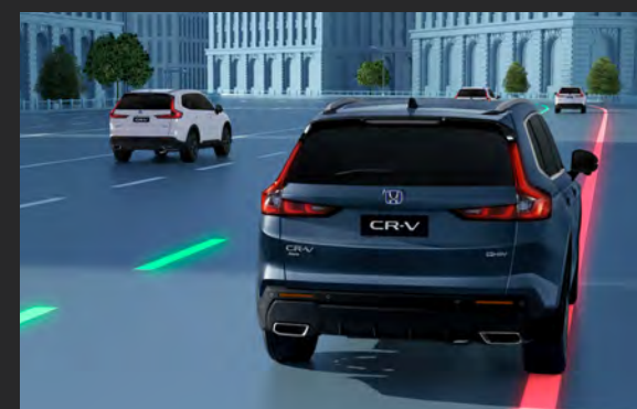
RDM™ Sistema para Mitigação de Evasão de Pista 5

Sistema que detecta as faixas de rodagem e ajusta a direção com o objetivo de auxiliar o motorista a manter o veículo centralizado nas faixas de rodagem.