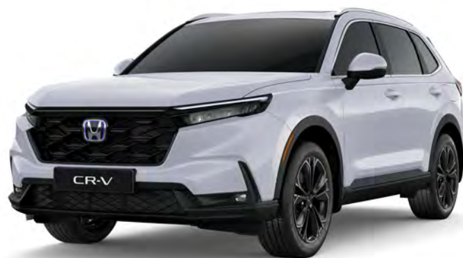
Branco Topázio Perolizado