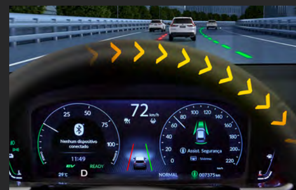
LKAS™ Sistema de Permanência de Faixa 4

Um alerta sonoro e visual é emitido ao detectar uma situação de possível colisão frontal e, se necessário, pode acionar automaticamente os freios para mais segurança do condutor.