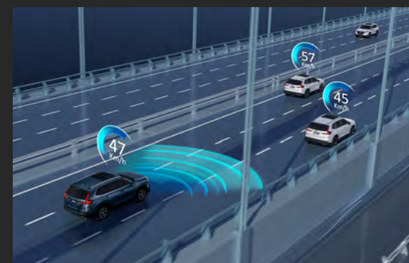
ACC™ com LSF - Controle de Cruzeiro Adaptativo com Low Speed Follow Acompanhamento em baixa velocidade 2

Sistema que realiza o ajuste elétrico de farol alto de acordo com a situação, mais conforto e segurança para você.