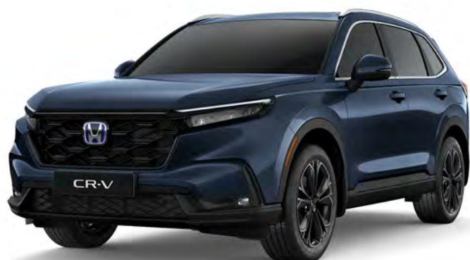
Azul Astral Metálico (Novo)