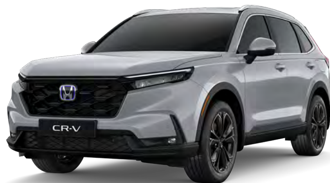
Prata Platinum Metálico