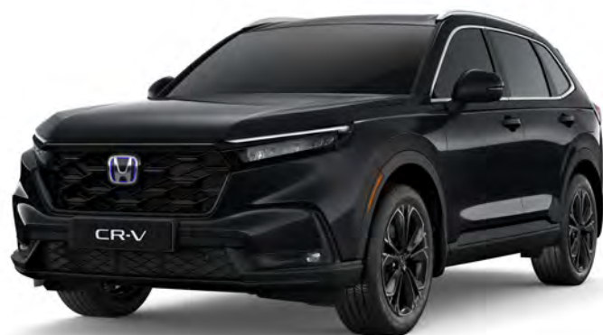
Preto Cristal Perolizado