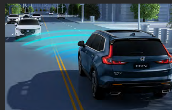
CMBS™ Sistema de Frenagem para Mitigação de Colisão 3

Sistema que auxilia o motorista a manter uma distância segura em relação ao veículo detectado à frente. Com função para acompanhamento em baixa velocidade, ideal para o dia a dia na cidade.