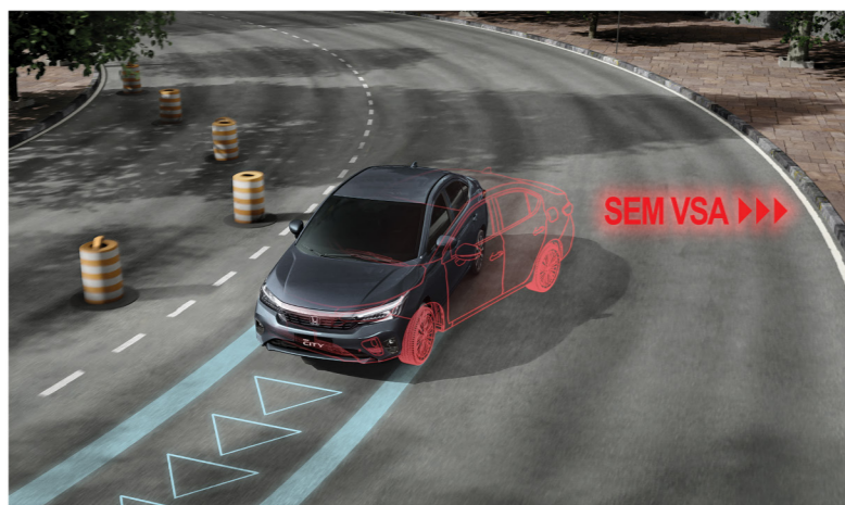
VSA - Assistente de estabilidade e tração