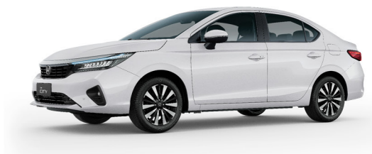
Branco Tafetá Sólido