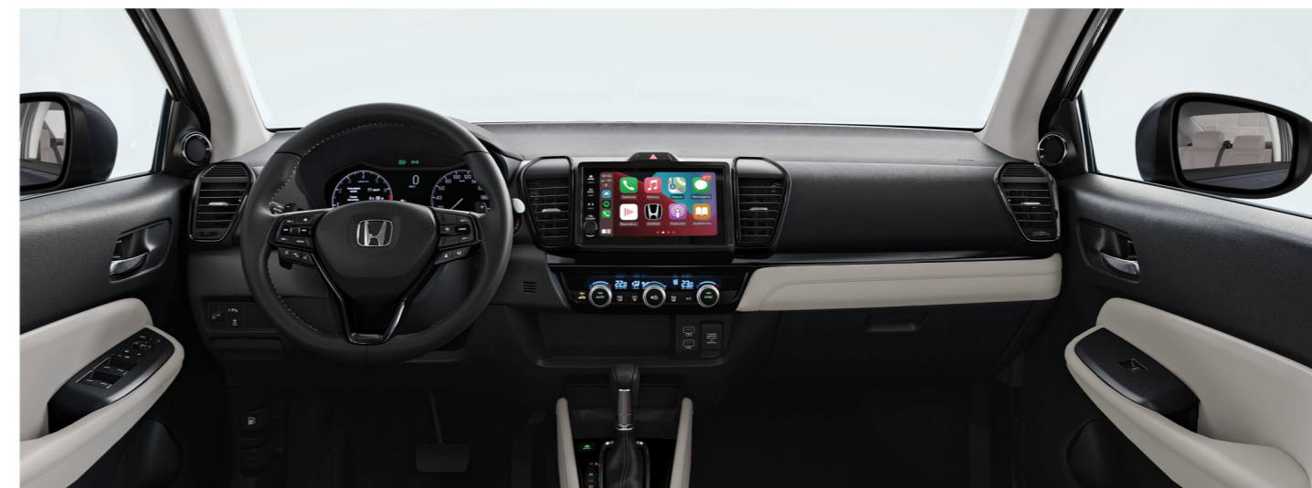
Amplo espaço interno