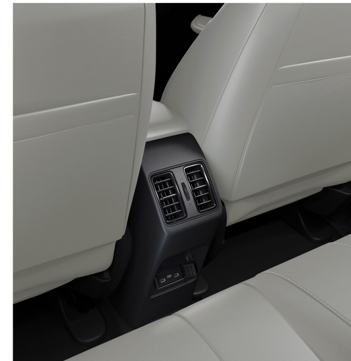
Portas USB traseiras tipo C e saídas de ar traseiras