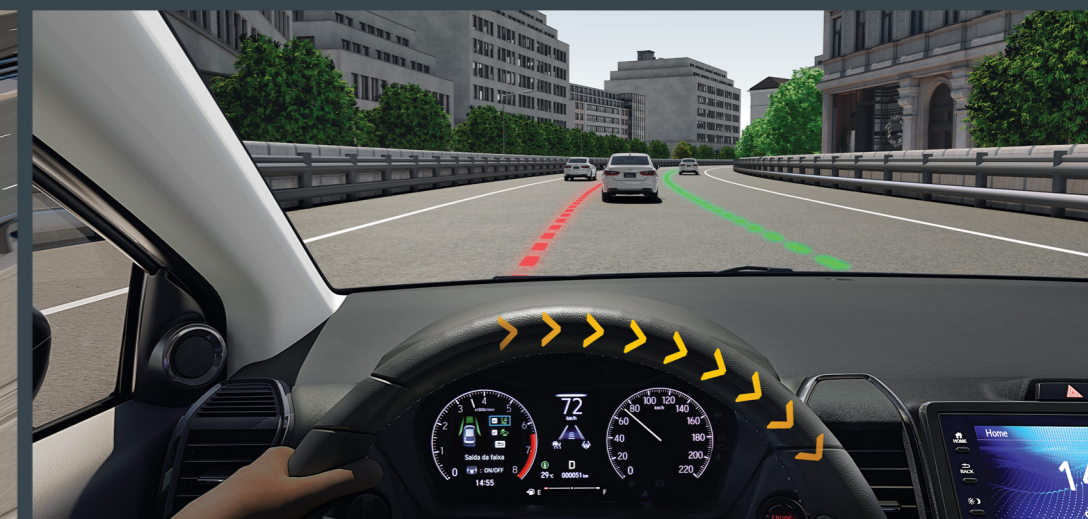
LKAS™ Sistema de permanência de faixa 2

Sistema que auxilia o motorista a manter uma distância segura em relação ao veículo à sua frente. Ideal para o dia a dia na cidade, com função para acompanhamento em baixa velocidade.