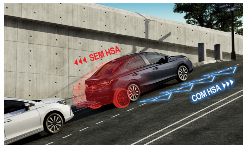
HSA - Assistente de partida em aclives