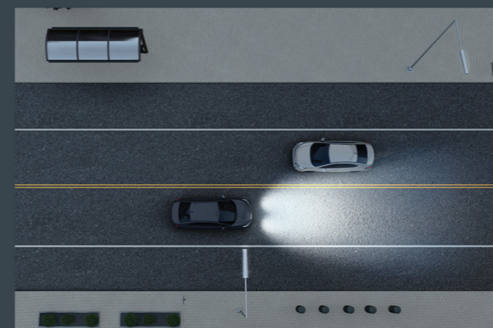
AHB™ Ajuste automático de farol 3

Sistema que detecta as faixas de rodagem e ajusta a direção, auxiliando o motorista a manter o veículo centralizado nas faixas de rodagem.