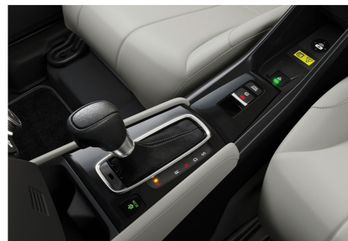
Transmissão automática tipo CVT

O paddle shift proporciona uma direção mais responsiva, pois permite ao condutor simular a troca de 7 velocidades ao alcance dos dedos . Enquanto os freios a disco nas rodas garantem maior eficiência e segurança nas frenagens.