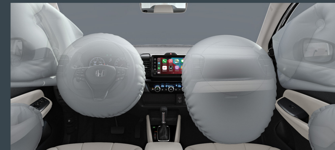
6 airbags (frontais, laterais e de cortina)