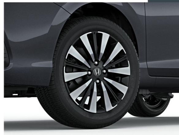
Rodas de liga leve de 16"