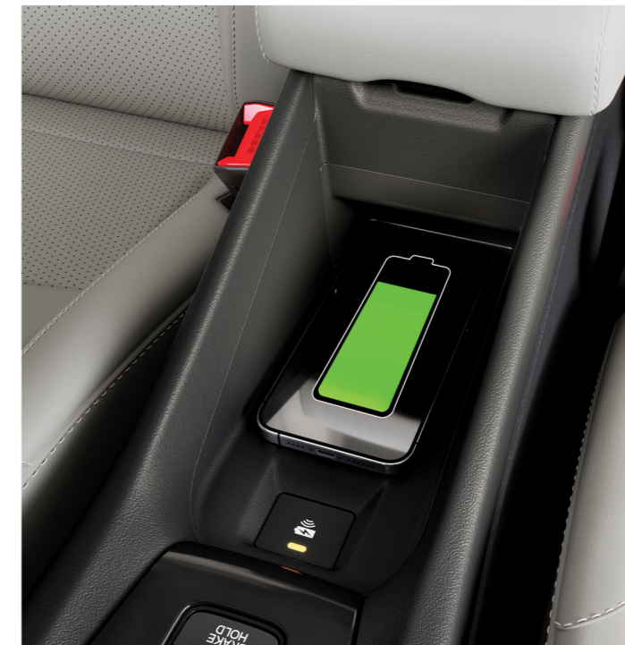
Carregador sem fio

O carro ideal para quem gosta de conforto.