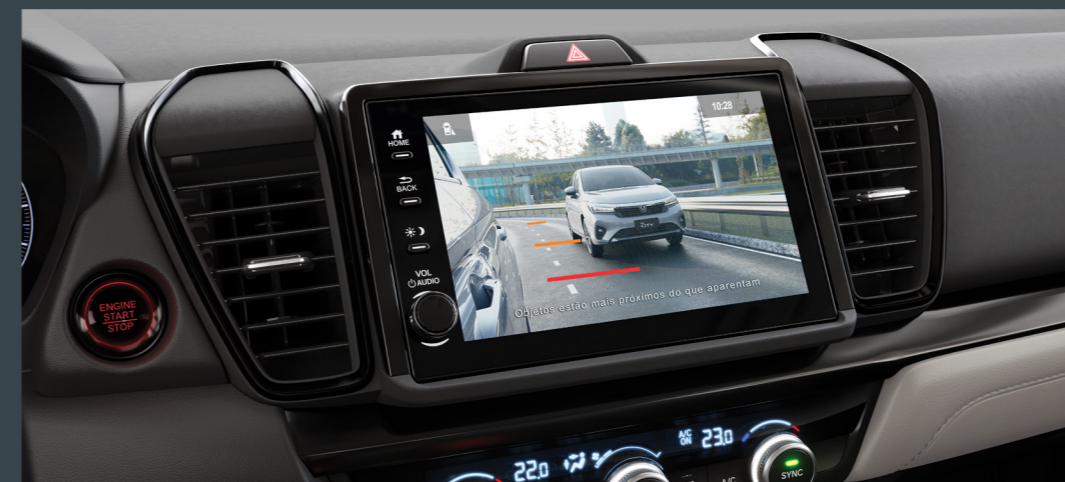
Assistente de redução de ponto cego Honda LaneWatch™