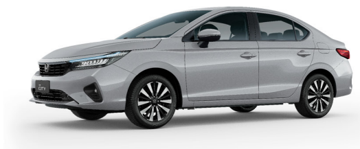
Prata Platinum Metálico