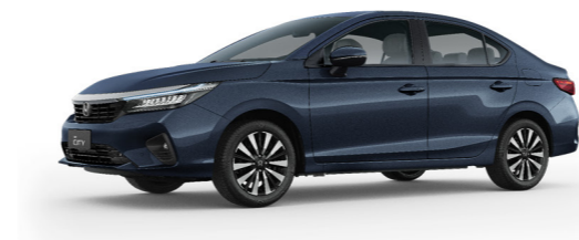
Azul Cósmico Metálico