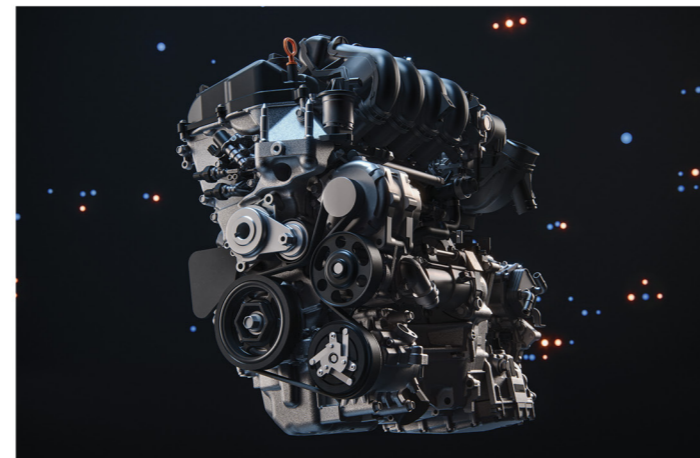
Motor 1.5l DOHC VTEC com Injeção Direta

Sua transmissão automática do tipo CVT (contínua variável) também garante uma condução mais suave com menos consumo de combustível.