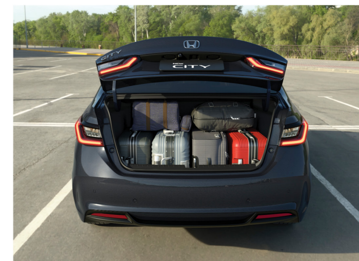
Porta-malas de 519 litros