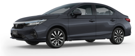
Cinza Basalto Metálico