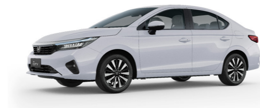
Branco Topázio Perolizado