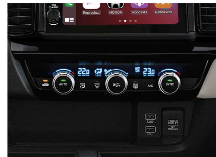
Sistema de ar-condicionado Dual Zone