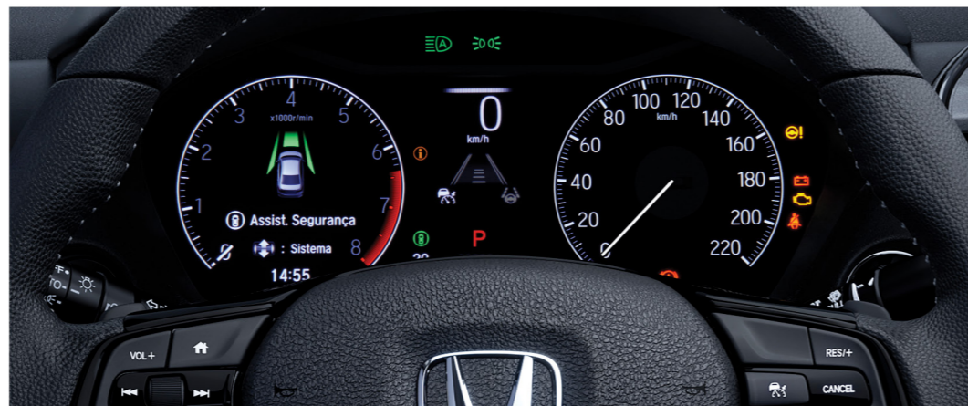
Painel Digital TFT de 7" de alta definição

O multimídia 8" do New City com interface sem fio para Apple Carplay® 7 e Android Auto™ 7 proporciona uma navegação mais amigável e intuitiva. Integra funções de áudio , Voice Tag , controles no volante e câmera de ré .