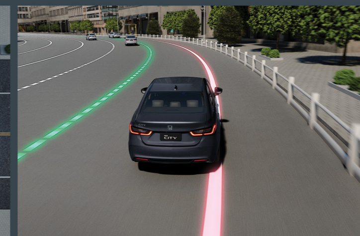
RDM™ Sistema para Mitigação de Evasão de Pista 4

Sistema de assistência automática de farol alto, que se ajusta de acordo com a situação.