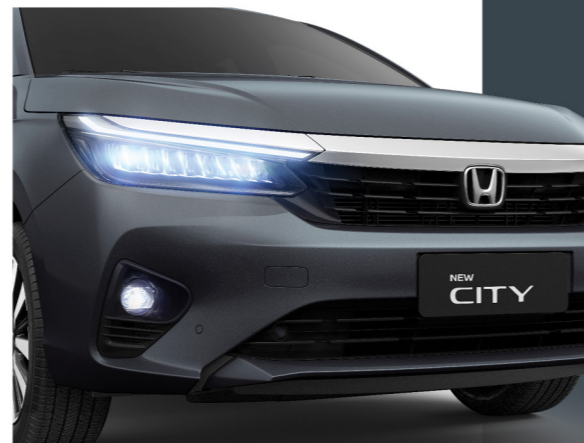
Conjunto óptico Full LED

Sua nova grade frontal com acabamento superior cromado traz um perfil mais afilado que se integra ao conjunto óptico Full LED e em conjunto com as barras horizontais longitudinais destacam a personalidade e a modernidade do modelo.