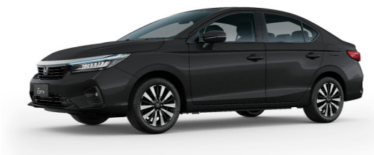
Preto Cristal Perolizado