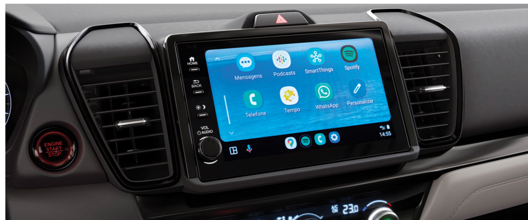
Multimídia 8" com interface para smartphones com Apple CarPlay™ e Android Auto™

O multimídia 8" do New City com interface sem fio para Apple Carplay® 7 e Android Auto™ 7 proporciona uma navegação mais amigável e intuitiva. Integra funções de áudio , Voice Tag , controles no volante e câmera de ré .