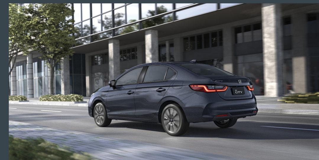
Novo para-choque traseiro