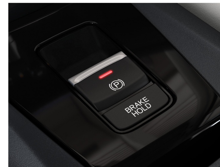
Freio de estacionamento eletrônico com função Brake-Hold