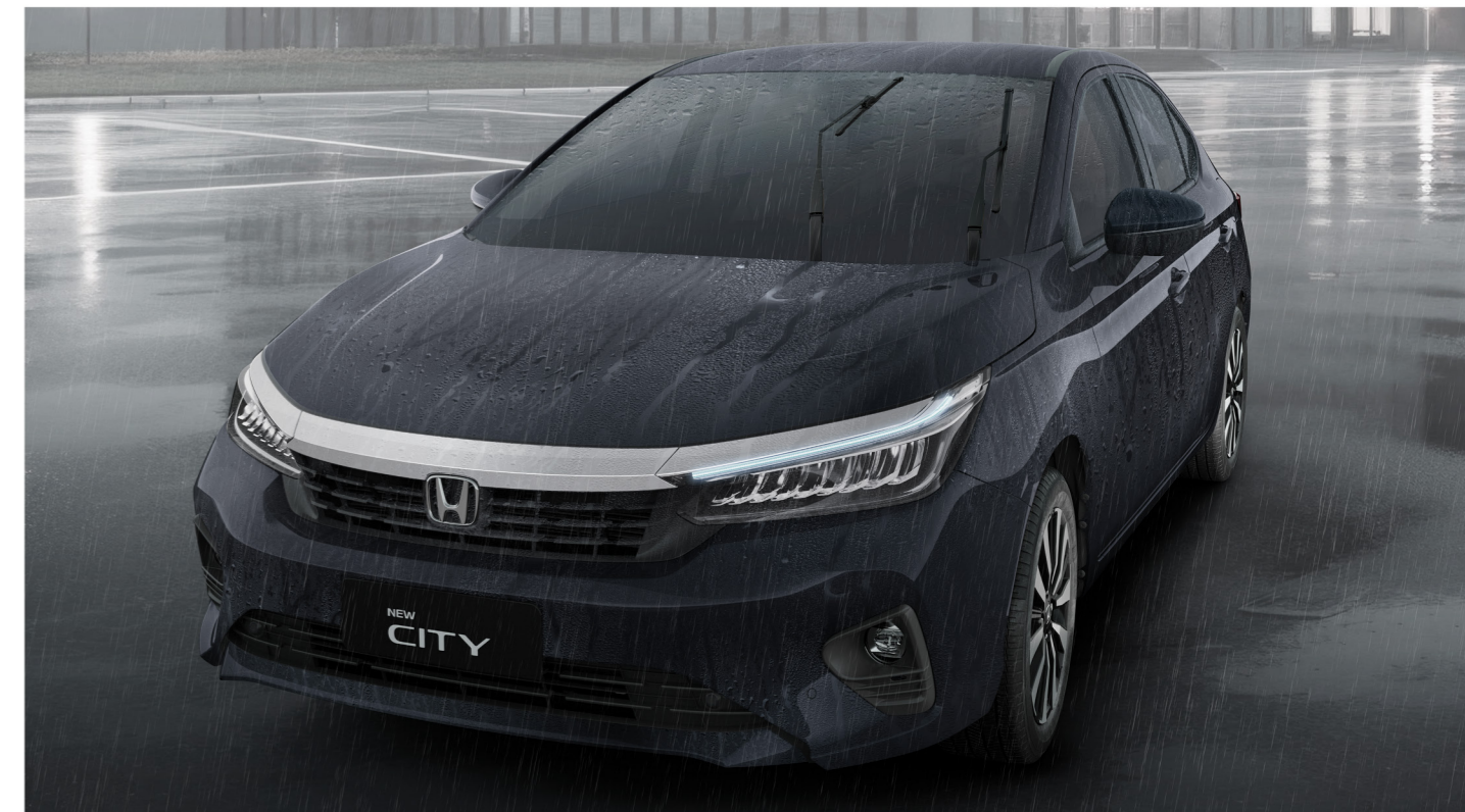
Limpador de para-brisa com função intermitente e sensor de chuva

O amplo espaço interno e interior refinado do New City conta agora com um novo console central moderno . Com um simples toque, acione de forma prática o freio de estacionamento eletrônico . E em situações de trânsito, a função Brake-Hold mantém o veículo parado até o pedal do acelerador ser acionado.